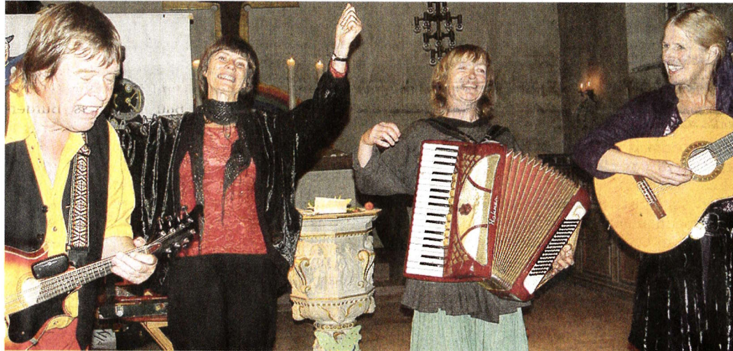
Die niederländische Gruppe Kajto spielt Folkmusik zum 30-jährigen Bestehen der Esperantogruppe.

Im Laufe der Jahre waren bei den Gruppenmitgliedern viele Esperanto-Sprecher aus anderen Ländern zu Gast und