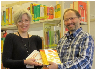
Libro donaco al la urba biblioteko

Das Jahr 2015 stand ganz im Zeichen des 92. Deutschen Esperanto-Kongresses, der mit ca. 190 Teilnehmern bei uns in Hameln stattfand und an dem erfreulicherweise 17 Mitglieder der Esperanto-Gruppe Hameln teilgenommen haben. Ein besonderes Augenmerk wurde darauf gehalten, möglichst viele Veranstaltungen auch der Öffentlichkeit zugänglich zu machen: so hatten wir das Esperanto-