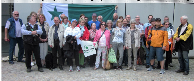
Jubileo „20 jaroj Esperanto-grupo Subvisurgo“ en Oldenburg