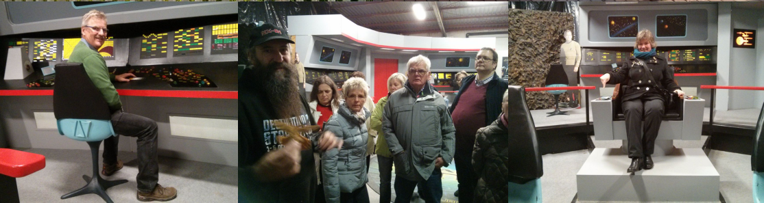
Impresoj pri la 12a Rata Rendevuo en Bad M nder kaj Bakede