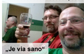
„Je via sano“