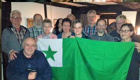
Mojosa etoso dum la antaŭkristnaska festo en la restoracio „Pfannekuchen“