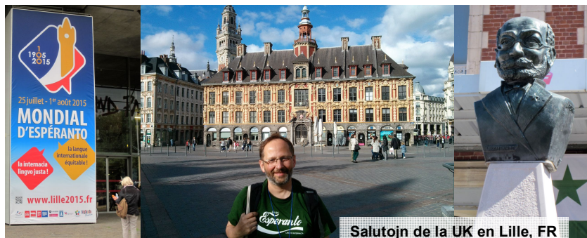
Salutojn de la UK en Lille, FR

Während unserer Treffen in der Sumpflume und im Freiraum waren wir zum größten Teil mit Vorbereitungen für den Esperanto-Kongress in Hameln beschäftigt, an Stichworten sei nur genannt: Stand der Anmeldungen für Essen, Übernachtungen und Ausflüge, Erstellen des Budgets und eines Arbeitsplans, Anschreiben an Sponsoren, Einladungen zur Eröff-