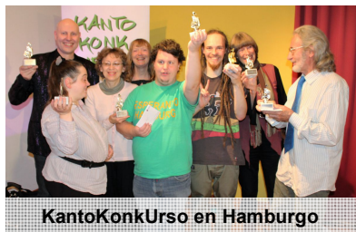
KantoKonkUrso en Hamburgo

ausführliche Berichte wiesen vor dem Kongress in der Dewezet auf das Ereignis hin, auch ein Bericht über die Jahreshauptversammlung. Und auch während des Kongresses und danach erschienen Berichte, z.B. auch im Kölner Stadtanzeiger. Das NDR-Fernsehen war vor Ort und brachte eine Internetreportage. Radio Aktiv brachte einen Jingle zum Kongress und einen Bericht vom Empfang beim Oberbürgermeister. Weiter erschienen dann noch im Laufe des Jahres in der Dewezet Berichte über den UK in Lille und das Rata Rendevuo in Bad Münster. Auch in „Esperanto aktuell“, „La Ondo de Esperanto“, „Esperantisto Slovaka“ und „La Lanterno Azia“ erschienen Beiträge zum Deutschen Esperanto-Kongress, in den beiden erstgenannten auch noch zum Rata Rendevuo. Kleinere Ankündigungen gab es noch im Gemeindebrief der Marktkirchen- und Müstergemeinde für den Gottesdienst auf Esperanto und in der Dewezet für den neuen Esperanto-Kurs.