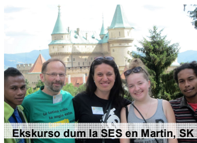
Ekskurso dum la SES en Martin, SK