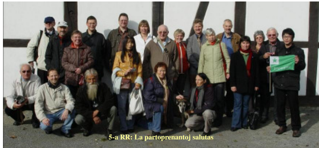
5-a RR: La partoprenantoj salutas

interalie ekumenan diservon kaj koncerton de „La kuracistoj“.