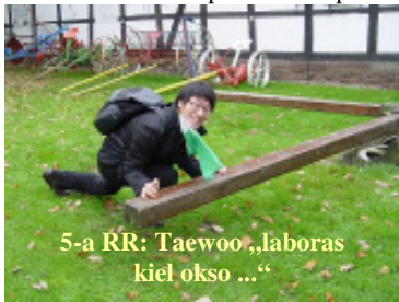
5-a RR: Taewoo „laboras kiel okso ...“

tie en septembro komenciĝis Esperanto-laborgrupo, kiun partoprenis du instruistoj kaj naŭ gelnantoj. Ankaŭ kurso por plenkreskulaj komencantoj kun kvar partoprenantoj komenciĝis en novembro. Bedaŭrinde en 2008 ni ne havis eksterlandajn gastojn. Al la 5-a „Rata Rendevuo“ ni invitis ĉi-jare en oktobro al Emmerthal. 23 Esperanto-amikoj el la grupoj en Hanovro, Bielefeld, Detmold, Herzberg kaj Subvisurgo venis kaj renkontiĝis en