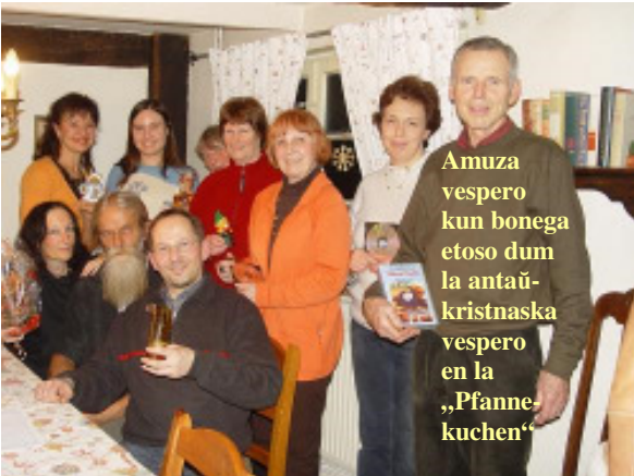
Amuza vespero kun bonega etoso dum la antaŭ-kristnaska vespero en la „Pfanne-kuchen“