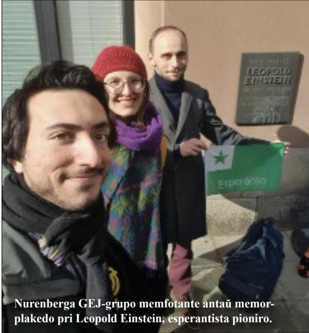
Nurenberga GEJ-grupo memfotante antaŭ memorplakedo pri Leopold Einstein, esperantista pioniro.