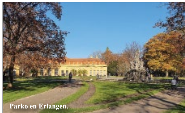
Parko en Erlangen.

Kiel magistra studento pri materialscienco, por mi estis pluraj poraj faktoroj por studi en Erlangen. Mia ĉefkialo estis, ke mia fako apartenis al unu el la fortoj/fokusoĵoj de la universitato. Alia granda avantaĝo estas la juneco kaj internacieco de Erlangen pro la universitato kaj pro