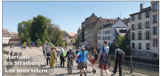
Marsante tra Strasburgo kun suna vetero.