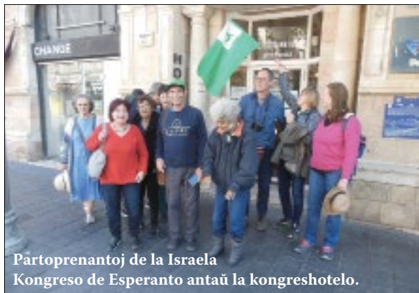
Partoprenantoj de la Israela Kongreso de Esperanto antaŭ la kongreshotelo.

Kion pri la kongreso mem? Vigla, foje improvizita, tre simpatia. Ni kunvenis (dum ni ne ekskursis tra la manova urbo) en historia hotelo en okcidenta Jerusalemo – foje sur la tegmenta teraso, foje en la kuirejo kaj manĝejo, aŭskultis fakajn prelegojn kaj multe babilis. Israelanoj devenas el ĉiuj