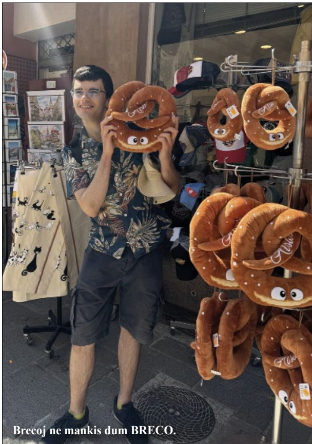
Brecoj ne mankis dum BRECO.