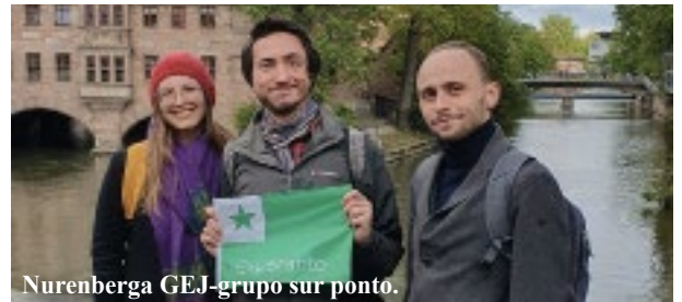
Nurenberga GEJ-grupo sur ponto.