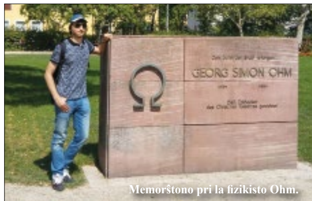
Memorŝtono pri la fizikisto Ohm.

enmigris kun hugenotoj hodiaŭ ne plu forte rimarkeblas, tamen la arĥitekturo daŭre montras la apartan esencon de Erlangen kompare al apudaj lokoj kiel Fürth aŭ Nürnberg.