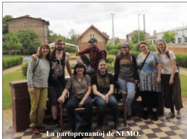
La partoprenantoj de NEMO.

Ni mem decidis pri nia programo. Okazis lingvokursetoj laŭ la diversaj niveloj de la novuloj, kaj ni ornamis multajn