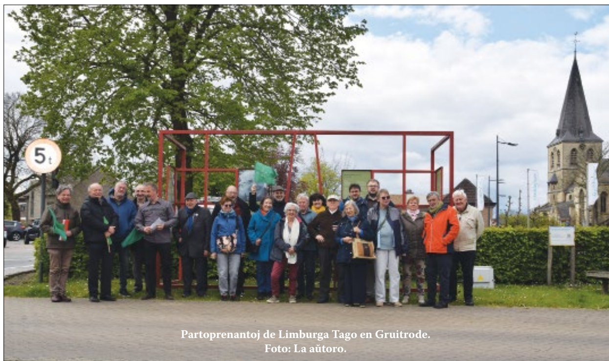
Partoprenantoj de Limburga Tago en Gruitrode.