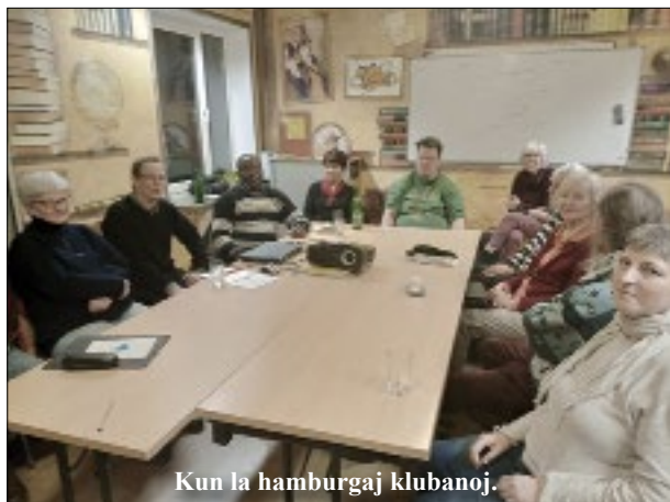
Kun la hamburgaj klubanoj.