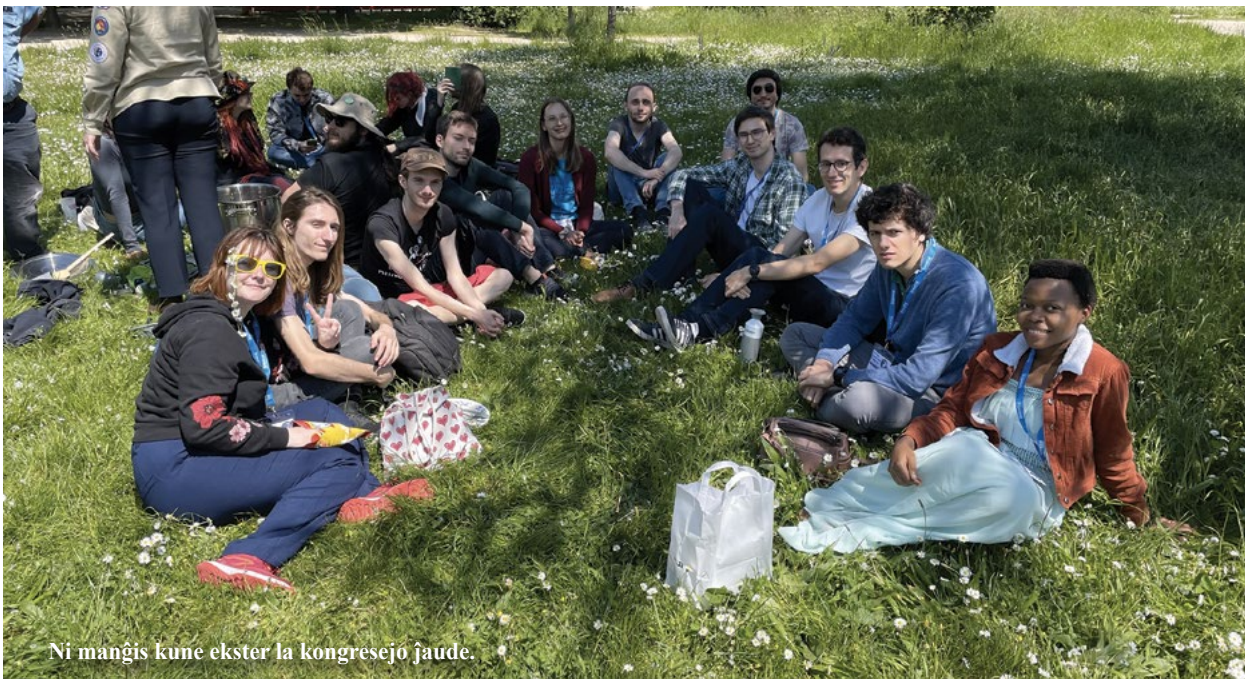
Ni manĝis kune ekster la kongresejo ĵaude.