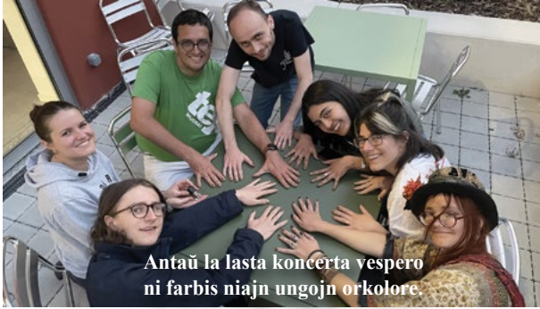
Antaŭ la lasta koncerta vespero ni farbis niajn ungojn orkolore.

da homoj. La plej bona ideo, kiun mi havis, estis ankaŭ aliĝi al BRECO, la junulara evento, kiu okazis samtempe kun la EEK. Mi tuj renkontis multe da uloj, kiuj parolis Esperanton kaj aĝis pli-malpli same kiel mi. Mi lernis, ke mi kapablas paroli nur Esperanton dum 5 tagoj sen problemoj.