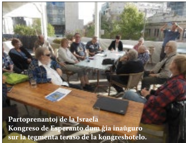
Partoprenantoj de la Israela Kongreso de Esperanto dum ĝia inaŭguro sur la tegmenta teraso de la kongreshotelo.