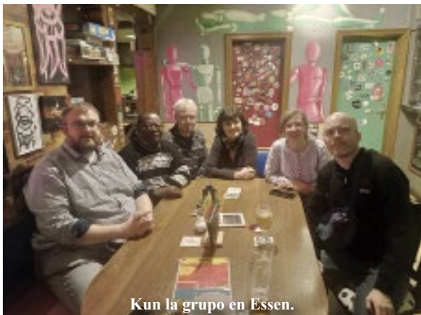
Kun la grupo en Essen.