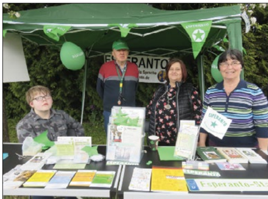
La informpavilono en la Juesholz-strato.

– Fine de Aprilo ni starigis informpavilonon okaze de la printempa festo en najbara Juesholz-strato, sub florantaj pomarboj. Ni disdonis multajn flugfoliojn, informis la interesiĝantojn pri la lingvo, pri ĝia internacia uzeblo kaj invitis ilin al niaj baldaŭaj someraj kaj aŭtunaj Esperanto-kursoj. Ni allogis preterpasantojn per prezentado de belaj Esperanto-libroj, al infanoj ofertis paperfaldadon kaj pretigon de kvin-pintaj verdaj steloj. Denove kun ĝojo ni konstatis, ke neniu kritikis Esperanton, do evidente ni atingis post plurjardeka agado, ke lernado de la internacia lingvo kaj okupiĝo pri ĝi apartenas al la normala socia kulturformo.