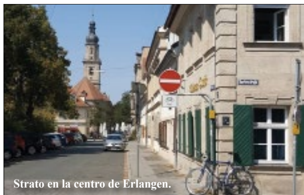
Strato en la centro de Erlangen.

Erlangen, kun siaj ĉ. 120.000 loĝantoj, estas la plej malgranda grandurbo de Bavario kaj situas en Nordbavario, en la regiono de Frankonio, nur 20 km for de Nürnberg (Nurenbergo). Historie gravas la urbo ĉefe pro la fakto ke la urbo bonvenigis kaj iusence refondiĝis de amaso da religiaj rifuĝintoj, kalvinistoj el Francio (ankaŭ konataj kiel hugenotoj), kiuj devis fuĝi de sia lando pro la religia persekutado post 1685. Kun helpo de tiu migradondo la novurbo Erlangen estis (re)konstruita kiel „idealurbo“ tiusence, ke la stratoj kaj domoj formiĝis laŭ planoj kun celitaj geometrioj. Kvankam multaj kulturaj aspektoj, kiuj