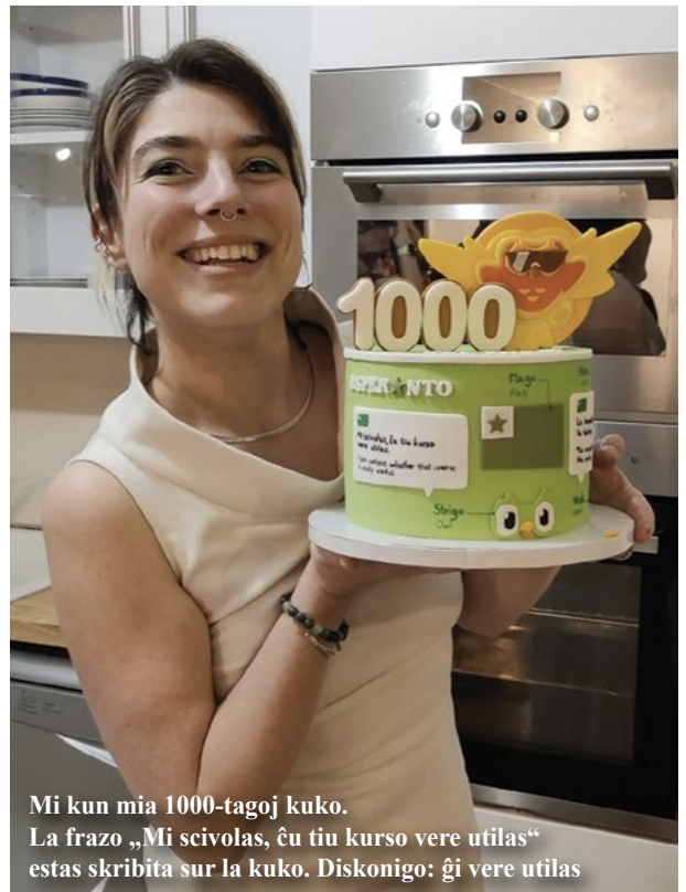
Mi kun mia 1000-tagoj kuko. La frazo „Mi scivolas, ĉu tiu kurso vere utilas“ estas skribita sur la kuko. Diskonigo: ĝi vere utilas

Kiam mi festis miajn 1000 sinsekvajn tagojn de Duolingo-lecionoj, la demando, kiun mi plej ofte ricevis de miaj amikoj, ne estis „Kion vi faris por daŭre lerni dum 1000 tagoj?“ aŭ „Ĉu vi povas instrui al mi kelkajn vortojn en Esperanto?“. Ne. Ĉiu demandis al mi: „Kun kiom da esperantistoj vi jam kunparolis?“. Kaj la respondos estis ... malmulte da uloj! Post la festo, mi tuj aĉetis biletojn por la Eŭropa Esperanto-Kongreso por finfine paroli kun multe