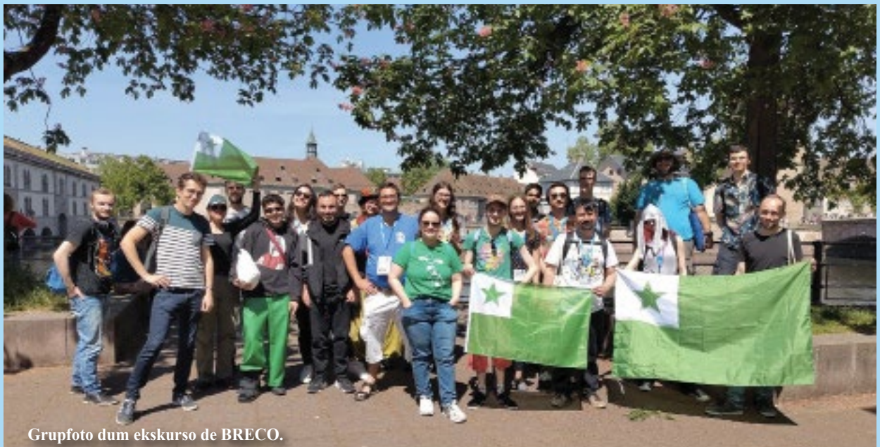
Grupfoto dum ekskurso de BRECO.

Office Franco-Allemand pour la Jeunesse Deutsch-Französisches Jugendwerk