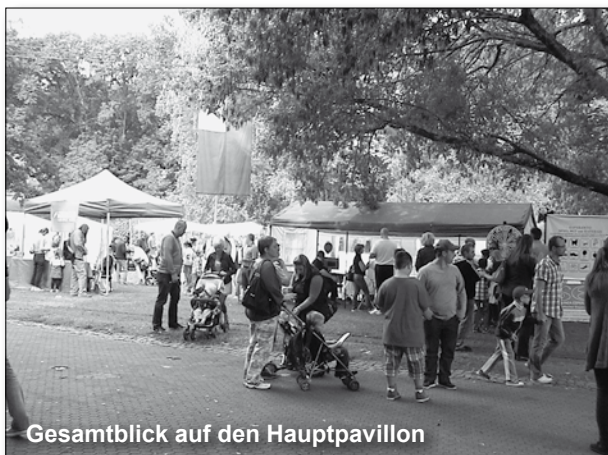
Gesamtblick auf den Hauptpavillon

Neben den Besuchern aus dem ganzen Saarland und