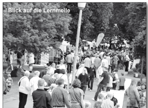
Blick auf die Lernmeile