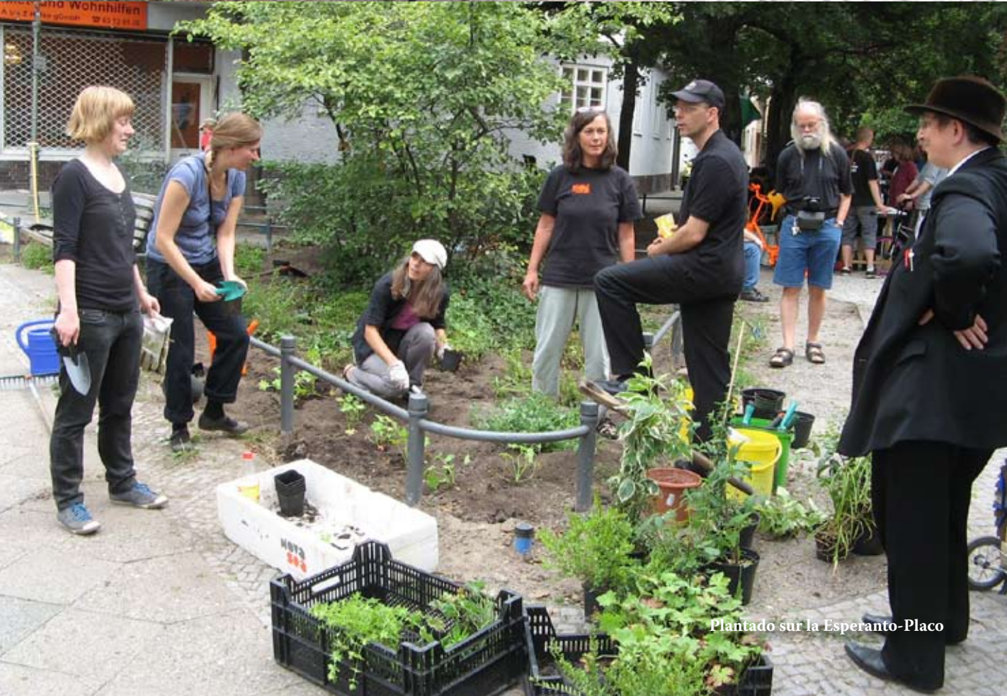
Plantado sur la Esperanto-Placo