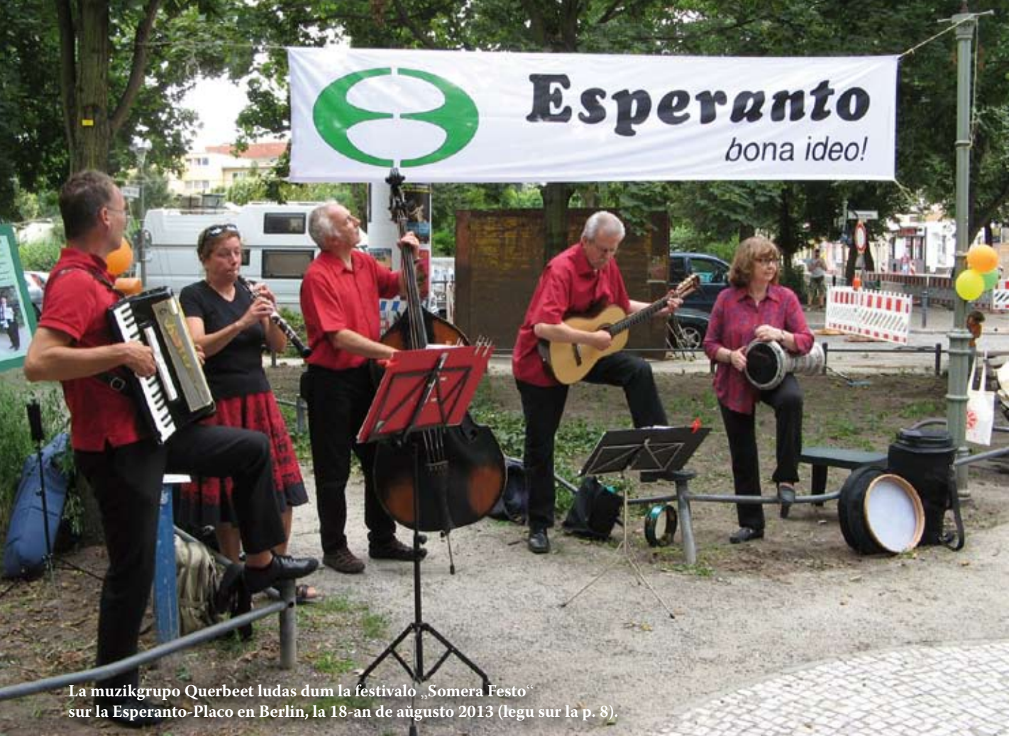
La muzikgrupo Querbeet ludas dum la festivalo „Somera Festo“ sur la Esperanto-Placo en Berlin, la 18-an de aŭgusto 2013 (legu sur la p. 8).