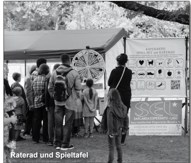
Raterad und Spieltafel

Wie im vergangenen Jahr war auch diesmal wieder der Saarländische Esperanto-Bund zusammen mit dem Becker-Meisberger-Institut auf dem Lernfest mit einem großen Informations-Pavillon und einer Minischule vertreten. Das berühmte „Raterad“ war neugestaltet