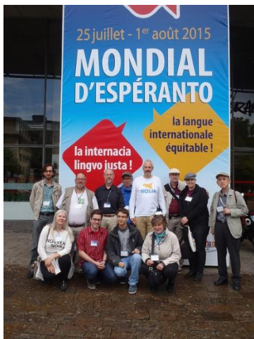
Twitter-Fans / Tviter-fanoj

2698 homoj el 80 landoj partoprenis en tiu ĉi jubilea kongreso. Ĝia temo "Lingvoj, artoj kaj valoroj en la dialogo inter kulturoj" grandparte trafe resumis la programon: Estis relative multaj artistaj prezentaĵoj, interalie koncertoj de Jonny M, La Platano & Sparka Ribelo, Ralph Glomp, JoMo, Martin & la talpoj kaj teatraĵoj. Tre bonaj estis la prelegoj de la astrofizikisto Amri Wandel pri la historio de la teorio de relativeco kaj pri nigraj truoj. Dediĉitaj al la temo "lingvo" estis aliaj prelegoj, ekzemple pri la hitita, farita de Cyril Brosch. La publika surscenejiĝo de la Akademio de Esperanto (AdE) evidentiĝis plian fojon, ke iuj anoj de AdE emas solvi lingvajn demandojn alie, ol tio estas antaŭvidita laŭ ĝia statuto; pli: http://www.ipernity.com/blog/55667/1398130 . Al la turisma programo apartenis interalie tuttaga ekskurso al Bruĝo, situanta en la najbara Belgujo (en escept-okaze suna vetero). Estis ankaŭ la eblo fari ekskurson al la 120 km for situanta okazigejo de la unua UK (1905): Bulonjo-sur-Mar. Prie memorigis ties urbestro en sia parolado kadre la solena malfermo de la 100a UK en Lillo. – Andreas