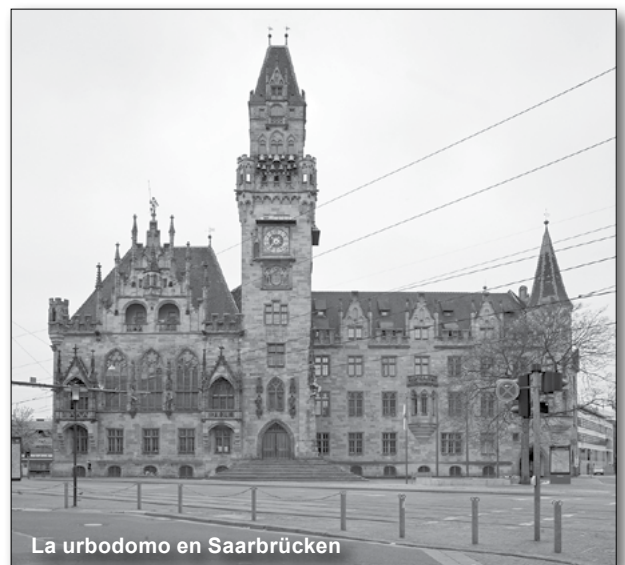
La urbodomo en Saarbrücken