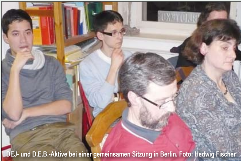
DEJ- und D.E.B.-Aktive bei einer gemeinsamen Sitzung in Berlin.