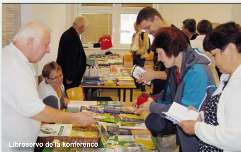
Libroservo de la konferenco