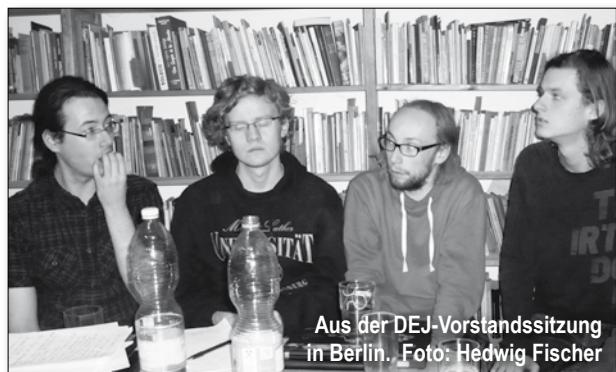
Aus der DEJ-Vorstandssitzung in Berlin.

Interessierst du dich für Vorstands- und Vereinsarbeit, und spielst mit dem Gedanken, dich zu beteiligen? Schreib an gej.fe@esperanto.de , neue Aktive sind immer gern gesehen.