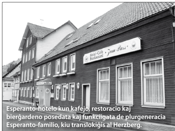
Esperanto-hotelo kun kafejo, restoracio kaj bierĝardeno posedata kaj funkciigata de plurgeneracia Esperanto-familio, kiu translokiĝis al Herzberg.

komisie de la esperantlingva „Hotel zum Pass“