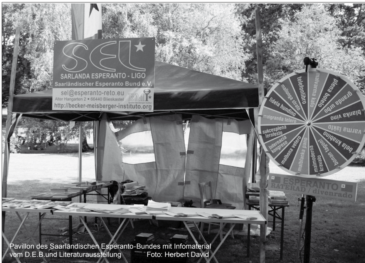
Pavillon des Saarländischen Esperanto-Bundes mit Infomaterial vom D.E.B. und Literatursammlung

Die erfolgreichen Teilnehmer bekamen dann für ihren Lernfest-Pass einen Klebekupon ausgehändigt. Bei mindestens 5 gesammelten Aufklebern konnten sie dann an der großen Tombola teilnehmen und tolle Gewinne erhalten.