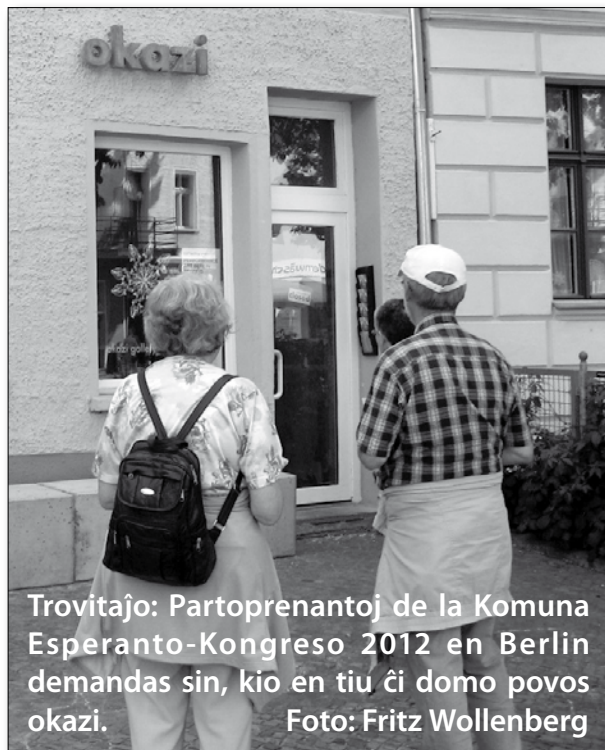
Trovitaĵo: Partoprenantoj de la Komuna Esperanto-Kongreso 2012 en Berlin demandas sin, kio en tiu ĉi domo povos okazi.

La Araba Komisiono dankis al TEJO, kies reprezentanto en Kairo en kunveno inter organizaĵoj, trovis la tempon por starigi budon pri Esperanto kun arablingvaj materialoj. La reprezentanto de TEJO tie estis Michael Boris Mandirola. EI TEJO-aktuale