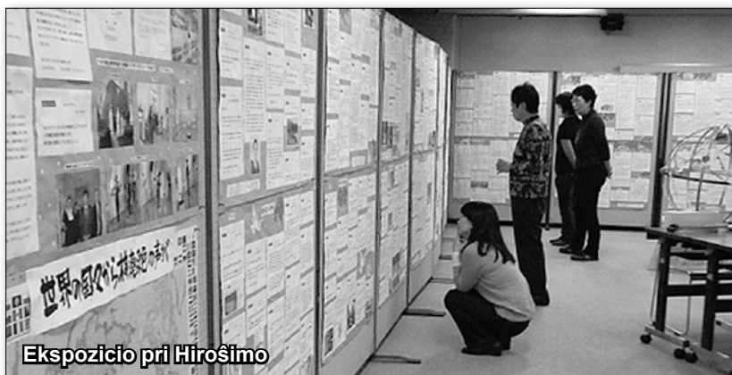
Ekspozicio pri Hiroŝimo