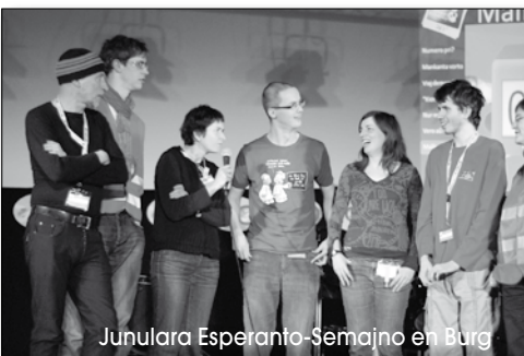
Junulara Esperanto-Semajno en Burg

to aktuell 2010/6, S. 10, und 2011/1, S. 5, berichtet und dem ausscheidenden Redakteur Alfred Schubert gebührend gedankt. Dem neuen Redakteur stehen zwei Lektoren für Esperanto und einer für Deutsch zur Seite.