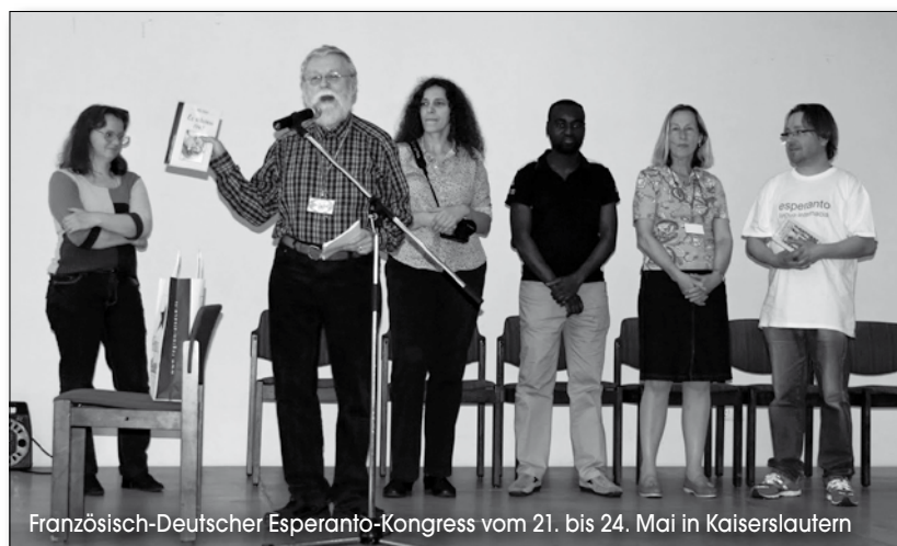
Französisch-Deutscher Esperanto-Kongress vom 21. bis 24. Mai in Kaiserslautern

Trotz aller Bemühungen ist die Zahl der ordentlichen Mitglieder weiter gesunken, wie schon in Esperanto aktuell 2011/1, S. 11, berichtet wurde. Obwohl jetzt auch fördernde Mitglieder (regelmäßige Spender) mitgezählt werden, liegt der D.E.B. jetzt bei 972 (1.004) und die DEJ bei 103 (120) Mitgliedern (in Klammern die Zahlen des Vorjahres).