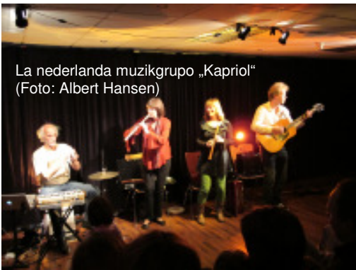
La nederlanda muzikgrupo „Kapriol“

Silvestre okazis balo kaj ni memkompreneble multe festumis kaj dancis. Se vi ŝatas esperantumi fine de la jaro kaj ne havas alergiajn kontraŭ infanbruo, konsideru iri al la NR. La atmosfero estis vivanta kaj ni