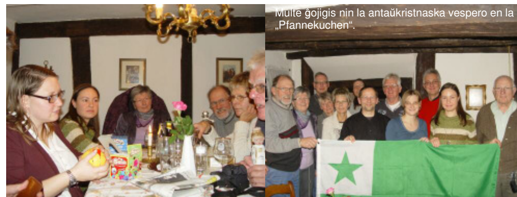
Multe ĝojigis nin la antaŭkristnaska vespero en la „Pfannekuchen“.