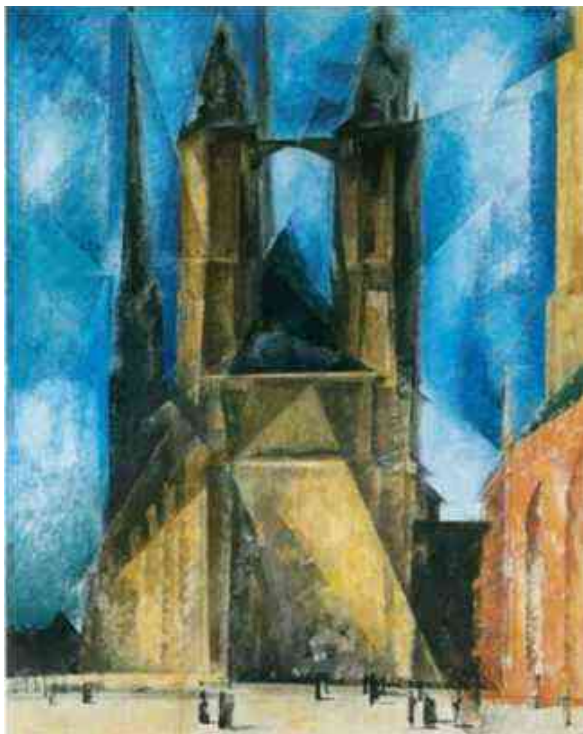
la preĝejo sur la foira placo en Halle

La forta impresio de liaj bildoj influis multajn aliajn artistojn de lia tempo. Tui impresigo de liaj bildoj fondis lian sukceson kaj famon. Ofte li verkis pri la sama objekto kelkfoje de diversaj malgrandaj