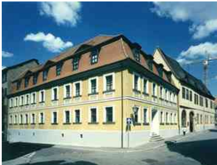
la naskiĝdomo de G. F. Händel, hodiaŭ muzeo