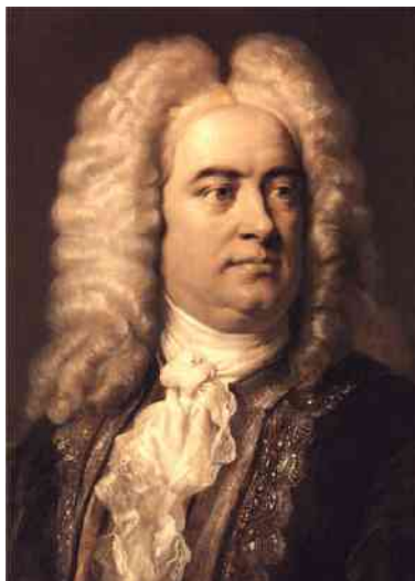
G. F. Händel, penetraĵo de Carl Jäger