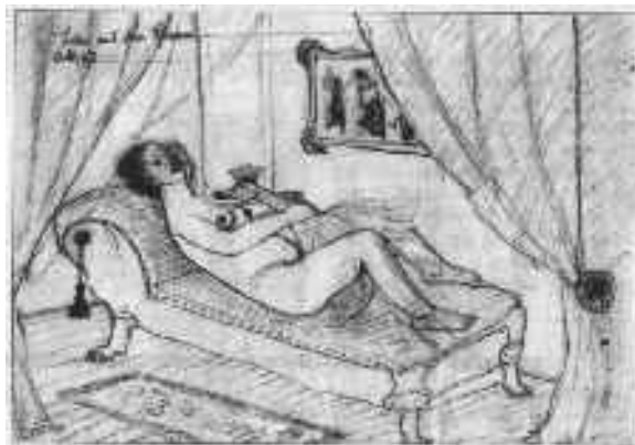
Leda kun la cigno (1957). kraĵono

Dum vizito en Halle vi trovos kopiojn de liaj bildoj en multaj urbaj muzeoj kaj galerioj.