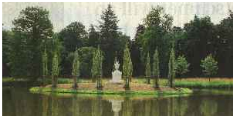
Rousseau-insulo kun novaj poploj

Ni renkontiĝos 10:00h ĉe la urbodomo de Wörlitz.