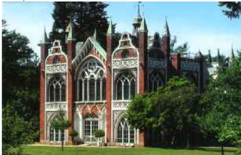
la Gotika Domo

Ekde nelonge la ĉefa simbolo de la parko de Vorlico denove brilas post renovigado. La Rousseau-insulo ricevis novajn poplojn (lombardaj nigraj poploj, Populus nigra 'Italica'). Ĉu ankaŭ la alegoria labirinto estas trairebla? Ni ne scias, ni vidos – tamen ne tiom gravas, ĉar en la parko de Vorlico ne mankas interesaj objektoj kaj ravaj rigardoj. Ĉifoje nia celo estas simile unike kiel ĉe nia jubilea aranĝo (20a REVO en 2004).