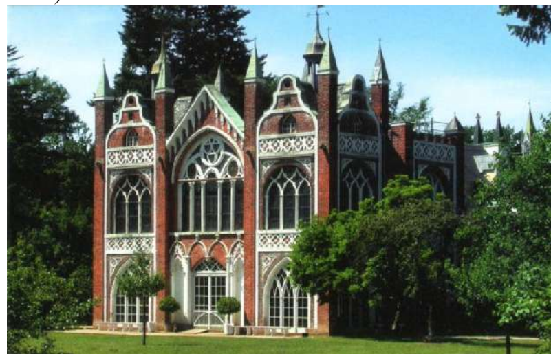
la Gotika Domo

Tiam ni vizitis la ĉefan kastelon. Nun ni volas viziti la Gotikan Domon. Ĝi estis la rifuĝejo de princo Franz ( pron. Franc ), kie li povas okupiĝi pri pomologio en la trankvilo de la naturo. Alia interesa unikaĵo de la Gotika Domo estas la pentraĵaj fenestroj. Ili estas bildrakonto pri la svisa historio. Princo Franz akiris la artajn vitraĵojn, kiam oni forigis ilin el la preĝejoj de Svisio. Multaj svisoj vizitas la parkon por vidi tiujn unikaĵojn. Maldekstre vi vidas bildon de la Gotika Domo, kiel ĝi aspektas de la ĝardena flanko (Tudor-gotika stilo). La alia flanko montras malsaman gotikan stilon (italan gotikon). La arkitekto Erdmannsdorf konstuis kelkajn tiajn diversflankajn konstuaĵojn (ekz. la Someran Salonon ĉe la kastelo aŭ la gastdomon en la parko Georgium en Dessau). Venu al Vorlico por ĝui kun ni tiun unikan parkon. En la jaro 2000 UNESCO deklaris la parkon Mondkulturan Heredaĵon