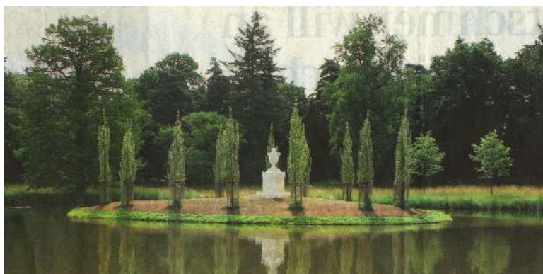
Rousseau-insulo kun novaj poploj

Ekde nelonge la ĉefa simbolo de la parko de Vorlico denove brilas post renovigado. La Rousseau-insulo ricevis novajn poplojn (lombardaj nigraj poploj, Populus nigra 'Italica'). Ĉu ankaŭ la alegoria labirinto estas trairebla? Ni ne scias, ni vidos – tamen ne tiom gravas, ĉar en la parko de Vorlico ne mankas interesaj objektoj kaj ravaj rigardoj. Ĉifoje nia celo estas simile unike kiel ĉe nia jubilea aranĝo (20a REVO en 2004).