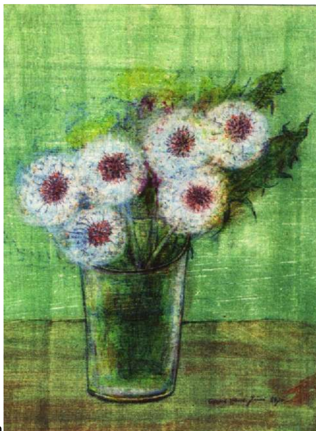
Floranta leontodo (1970)

En la jaro 1973 la urbo Halle honoris lin per la artpremio de la urbo. Okula malsano malebligis al li la pentradon ekde 1975. Okaze de lia 70a naskiĝtago la fondaĵo Moritzburg dediĉis al li ekspozicion, kiun li ankoraŭ povis ĉeesti. La 21-an de aŭgusto 1976 Albert Ebert mortis.