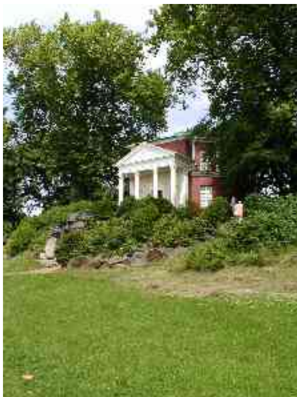
la templo Pantheon

Se vi bezonas pliajn informojn, demandu la Esperanto-grupon Panoramo ( kontaktinformoj sur la lasta paĝo )