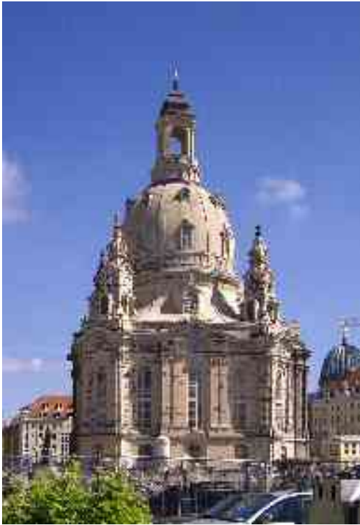
la rekonstruita Frauenkirche