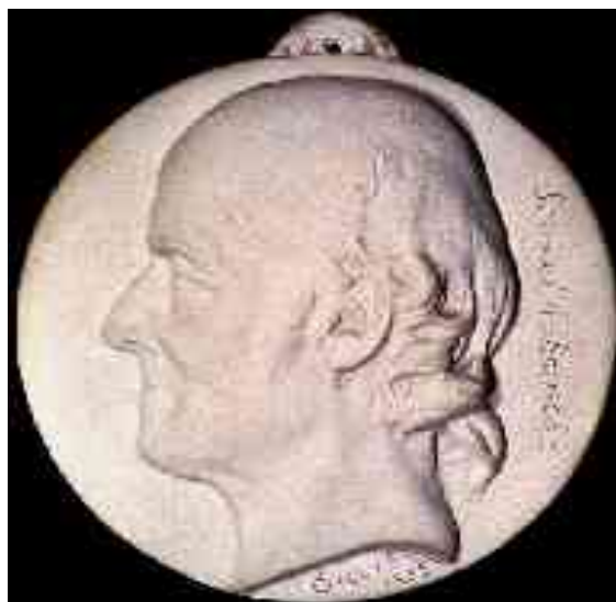
reliefo farita de Pierre-Jean David d'Angers

Hahnemann naskiĝis la 10-an de aprilo 1755, ĝuste antaŭ 250 jaroj, kiel filo de porcelanpentristo Christian Gottfried Hahnemann en Meißen. Li studis medicinon, sed li ofte ŝanĝis la studojn kaj la urbojn. Kiam li estis 24-jaraĝa li regis jam sep lingvojn skribe kaj buŝe. Baldaŭ li estis atestimata tradukisto. La studadon li financis per tradukaj laboroj. Post nekredible multstacia vivitinero tra Germanio li alvenis kiel 56-jaraĝa privata kuracisto en Lepsiko, kie li trovis iom da trankvileco. Entute li loĝis dum sia vivo en 27 urboj, inter aliaj en Hettstedt, Dessau, Gotha kaj Hamburgo. Li ofte laboris kiel privata kuracisto por riĉaj pacientoj kaj kiel tradukanto de sciencaj verkoj.