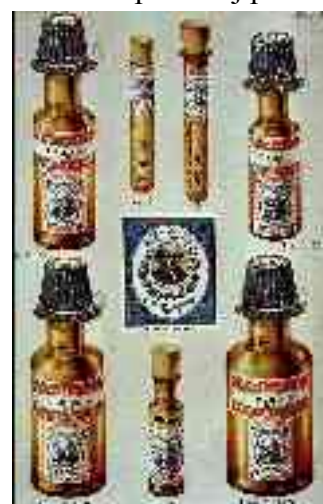
homeopataj medikamentoj en boteletoj kaj cilindroj, Lepsiko 1889

Krom la zorgado por sia familio kun kvin infanoj li sukcesis disvolvi novan teorion pri la funkciado de medikamentoj. Li testadis multajn substancojn en fortaj diluecoj, iliajn efikojn al klinikaj bildoj. Li observis ke substancoj, kiuj efikas ĉe sana homo bildon de iu malsano, taŭgas por kuraci pacieron kun ĝuste tiu malsano. Tiel li formulis la bazan tezon de homeopatio: Simila kuracu similan (latine: similia similibus curantur ). En Lepsiko li devis defendi sian teorion kontraŭ multaj malamikoj. Ĉefe la apotekistoj kontraŭis lin, ĉar la medikamentoj de Hahnemann estis pli malmultekostaj ol la kutimaj. La apotekistoj de Lepsiko atingis ke Hahnemann ne plu rajtis apliki siajn medikamentojn, ĉar mankis al li unu necesa permeso por kuracistoj. En 1821 li forlasis Lepsikon kaj venis al Köthen. La princo Ferdinand permesis al li la kuracadon kaj esploradon. Tie li povis fini siajn instrukciojn pri la elekto kaj la aplikado de la novaj medikamentoj. Post 14 sukcesaj jaroj en Köthen Hahnemann iris al Parizo en 1835. Kiel 80-jaraĝa vidvo li edziĝis kun la 35-jara parizano Melanie, kiu leginte lian „Organon de racia kuracmetodo“ decidis viziti lin kaj lasi sin kuraci laŭ la nova metodo. La tempo en