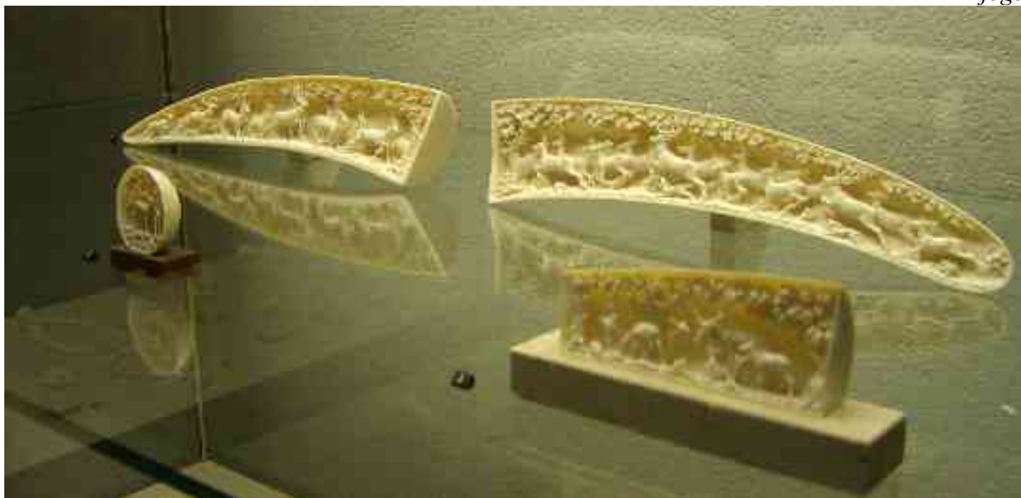
skulptaĵo en la ebura muzeo en Erbach