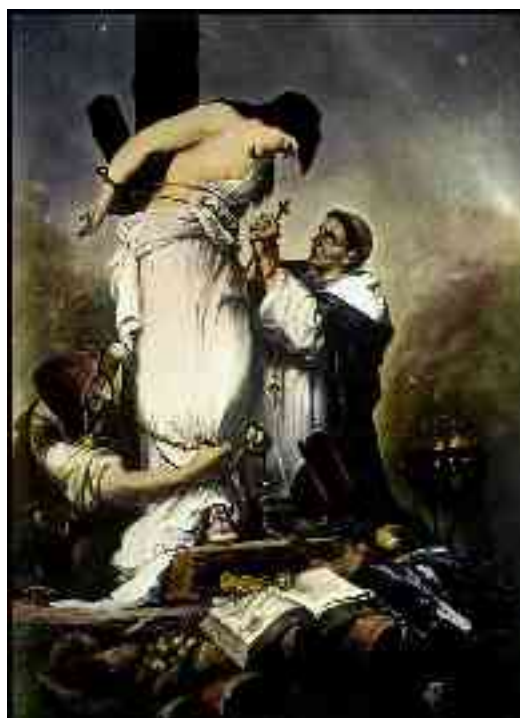
bruligo de sorĉistino en la 16a jarcento, anonima pentraĵo ĉ. 1860

Li naskiĝis kiel filo de lepsika familio de eruditoj. Li studis juron en la universitatoj Lipsiko kaj Frankfurto/Odro. Thomasius doktoriĝis en la jaro 1679. Post kleriga vojaĝo tra Nederlando li laboris dum mallonga tempo kiel advokato en sia naskiĝurbo. Baldaŭ li komencis labori kiel privata docento. En la jaro 1687 li same kiel antaŭ li Martin Luther uzis afiŝojn por publikigi. Li fiksas afiŝojn sur 14 lepskajn pordojn, per kiuj li informis per germana lingvo, ke okazos privata prelego en germana lingvo.