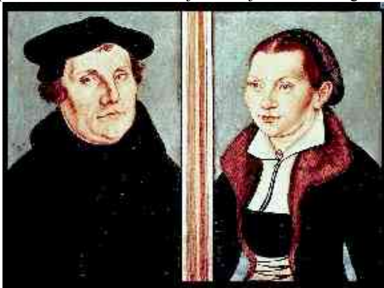
Luther kaj lia edzino Katharina von Bora duobla portreto de Lucas Cranach d.Ā. (la pli aĝa), 1529

Katharina von Bora naskiĝis je la 29.01.1499 en Lippendorf kiel filino de la saksa malriĉa familio de aristokratio. Katharina havis 10-jarojn, kiam la patro donis ŝin al monakinejo. En la jaro 1523 ŝi fuĝis al Wittenberg (pron. Vitenberg) per helpo de Martin Luther. Katharina von Bora kaj Martin Luther geedziĝis 1525. Ŝi zorgis pri la mastrumado de la familio. Per 3 filoj kaj 3 filinoj la familio pligrandiĝis. Post la morto de Martin Luther ŝi devis fuĝi plufoje el Wittenberg. En la jaro 1552 ŝi fuĝis pro la malsano pesto al la urbo Torgau. Dum tiu fuĝo la ĉevaloj subite ektimis kaj Katharina falis surteren kaj vundis sin tiel malbone, ke ŝi mortis la 20an de decembro 1552. Ĉiujare en junio oni memorigas en Wittenberg per la urba festo "La geedziĝo de Luther" pri la fuĝo de Katharina von Bora el la monakinejo.