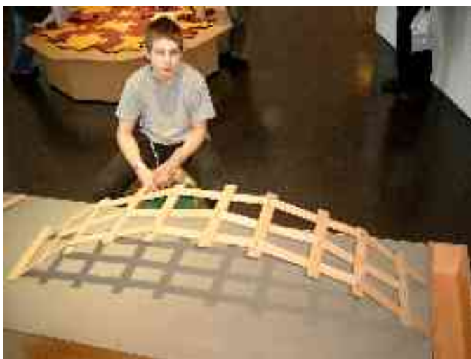
konstruado de ponto en Mathematikum en Giessen