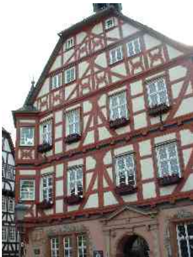
faktraba domo en Grünberg