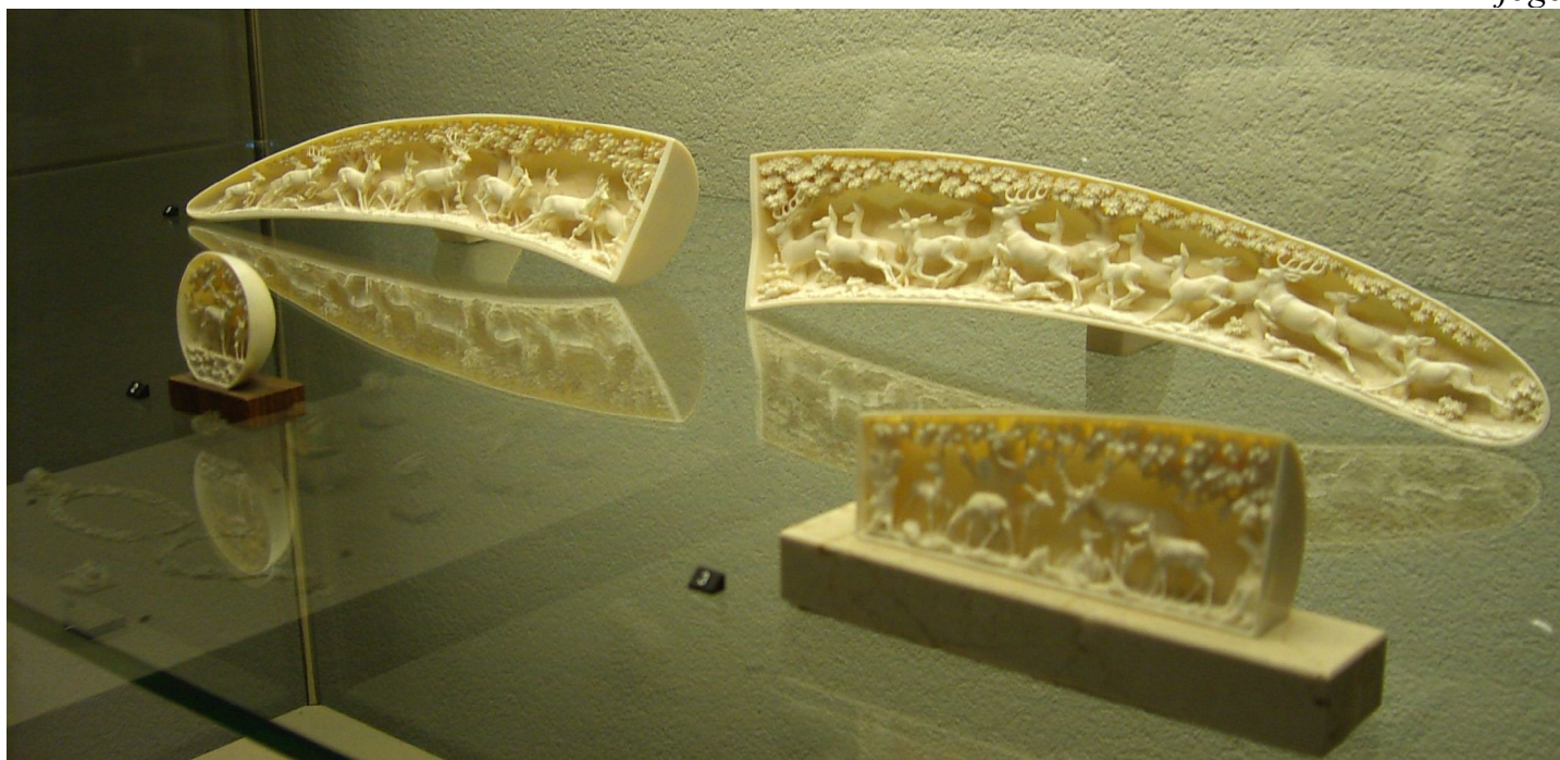
skulptaĵo en la ebura muzeo en Erbach