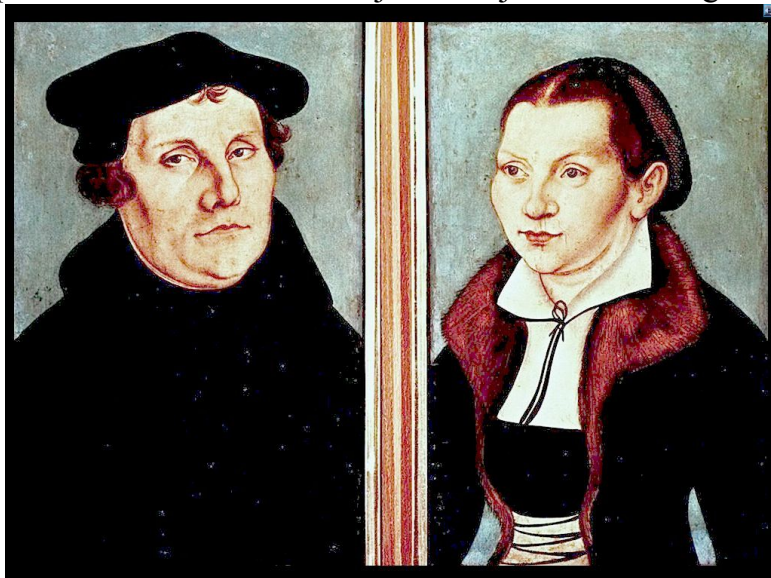
Luther kaj lia edzino Katharina von Bora duobla portreto de Lucas Cranach d.Ā. (la pli aĝa), 1529

Katharina von Bora naskiĝis je la 29.01.1499 en Lippendorf kiel filino de la saksa malriĉa familio de aristokrato. Katharina havis 10-jarojn, kiam la patro donis ŝin al monakinejo. En la jaro 1523 ŝi fuĝis al Wittenberg (pron. Vitenberg) per helpo de Martin Luther. Katharina von Bora kaj Martin Luther geedziĝis 1525. Ŝi zorgis pri la mastrumado de la familio. Per 3 filoj kaj 3 filinoj la familio pligrandiĝis. Post la morto de Martin Luther ŝi devis fuĝi plufoje el Wittenberg. En la jaro 1552 ŝi fuĝis pro la malsano pesto al la urbo Torgau. Dum tiu fuĝo la ĉevaloj subite ektimis kaj Katharina falis surteren kaj vundis sin tiel malbone, ke ŝi mortis la 20an de decembro 1552. Ĉiujare en junio oni memorigas en Wittenberg per la urba festo "La geedziĝo de Luther" pri la fuĝo de Katharina von Bora el la monakinejo.