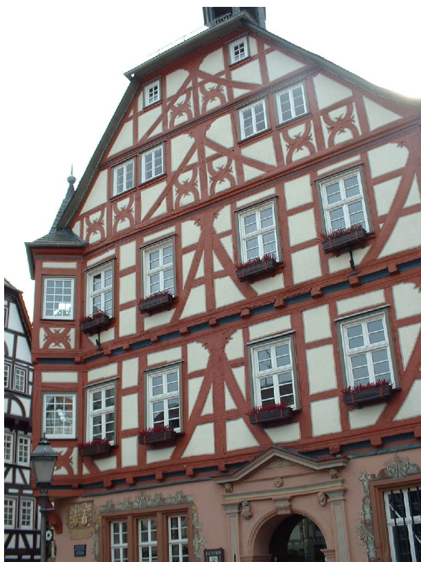
faktraba domo en Grünberg