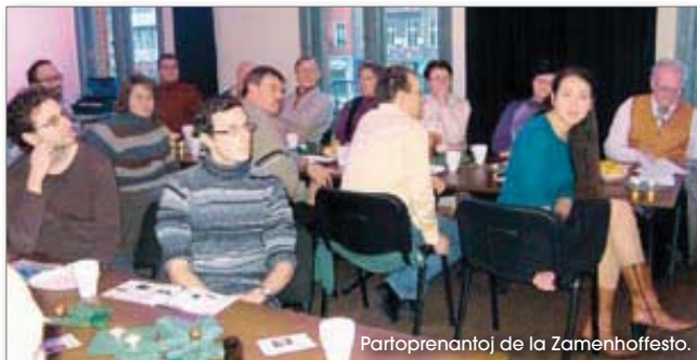
Partoprenantoj de la Zamenhoffesto.

Post la grandiozaj kaj entuziasmaj Zamenhofsemajno kaj Zamenhoffesto en 2009 ni ĉiuj deziris pli trankvilan kaj ankaŭ ne tiel plenŝtopitan feston rilate al la datreveno de la naskiĝo de d-ro Ludoviko Zamenhof. Ĉi-foje la temo estis ankaŭ dediĉita al la „Internacia jaro de la libro“.