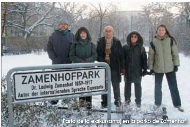
Parto de la ekskursantoj en la parko de Zamenhof