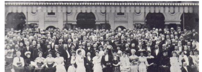
Der erste Esperanto-Weltkongress 1905 in Frankreich

Rasch verbreitete sich die Sprache und bald entstanden diverse Esperanto-Zeitschriften und -Organisationen. 1906 wurde der Deutsche Esperanto-Bund gegründet, 1908 der Esperanto-Weltbund.